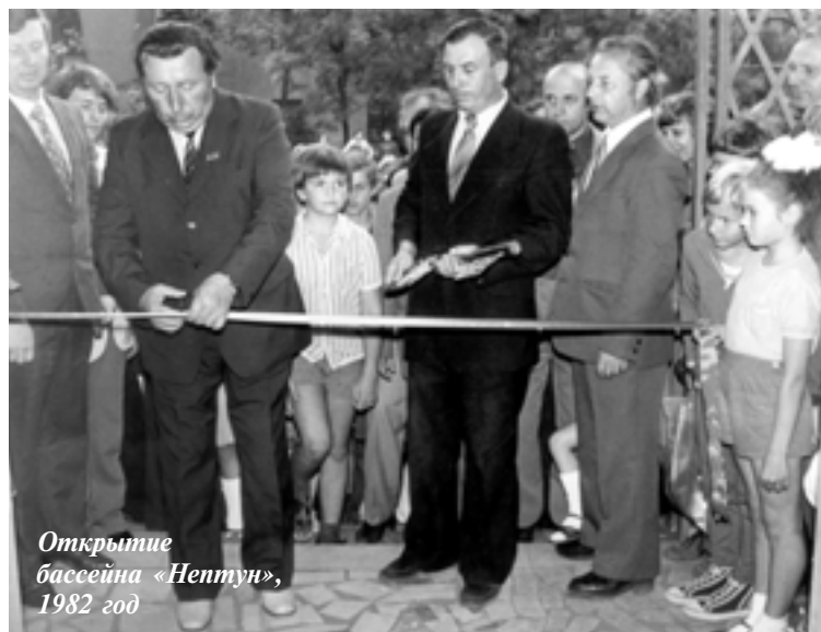
Открытие бассейна «Нептун», 1982 год