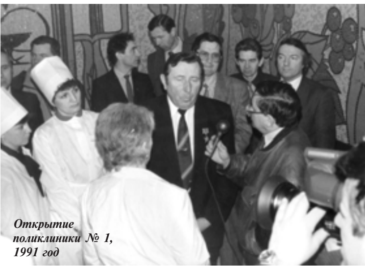
Открытие поликлиники № 1, 1991 год