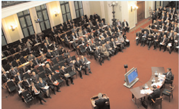
Продолжение. Начало на 5 стр.

24 декабря 2009 года в Торгово-промышленной палате РФ прошло расширенное заседание Правления ТПП РФ